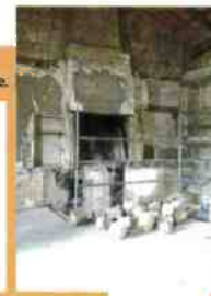
Évier à déversoir extérieur