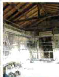
La salle supérieure, 2021